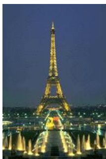
KeyLog I&S Kooperationspartner in Frankreich